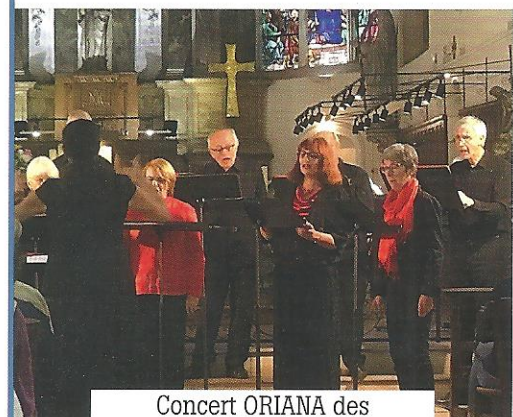
Concert ORIANA des Journées du Patrimoine