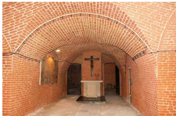
Monastère de Varsovie La crypte devenue sanctuaire de mémoire