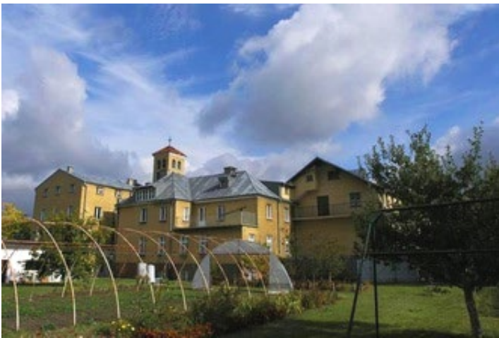
Monastère de Wroclaw

Aujourd'hui trois monastères existent encore en Pologne : Varsovie, Wroclaw (anciennement Lwow), Siedlce. Chacune de ces Communautés a connu un parcours hérissé d'obstacles et d'heures tragiques à l'image de l'histoire de la Pologne.