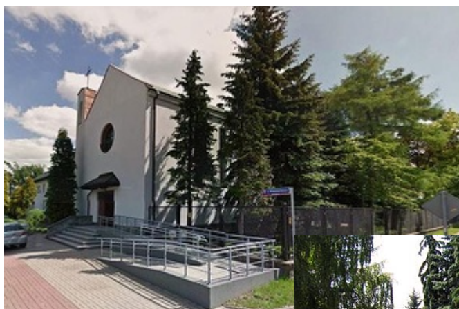
Monastère de Siedlce