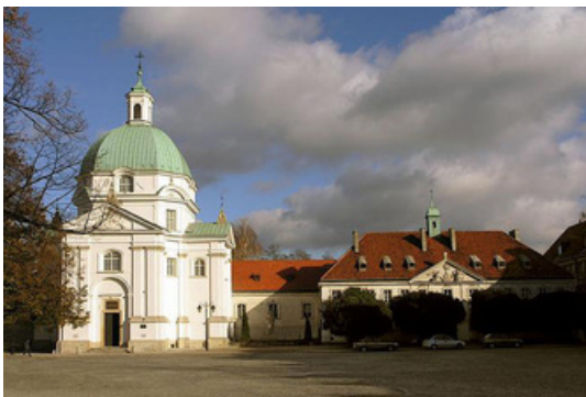
Monastère de Varsovie vue générale

l'Institut en Pologne ; il y était encore lors de l'arrivée des Russes en 1946 et traversa les soubresauts de l'Histoire puisque la Communauté est bien vivante aujourd'hui.