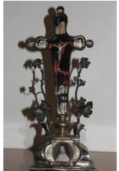
Monastère de Wroclaw Croix avec un portrait de Mère Mectilde